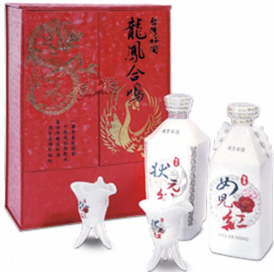
狀元紅、女兒紅各1瓶

以「狀元紅」及「女兒紅」組合，配上一對仿古磁杯，精緻喜氣包裝，猶如孩子中狀元或出嫁時，父母的期盼喜悅之情。附贈「加官進爵」仿古瓷三足爵瓷杯。